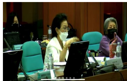
ครั้งที่ 11/2565 เมื่อวันที่ 23 พฤศจิกายน 2565

1. โครงการเปิดสอนหลักสูตรในลักษณะโครงการพิเศษ จำนวน 2 หลักสูตร มติ ที่ประชุมอนุมัติโครงการเปิดสอนหลักสูตรในลักษณะโครงการพิเศษ จำนวน 2 หลักสูตร คือ